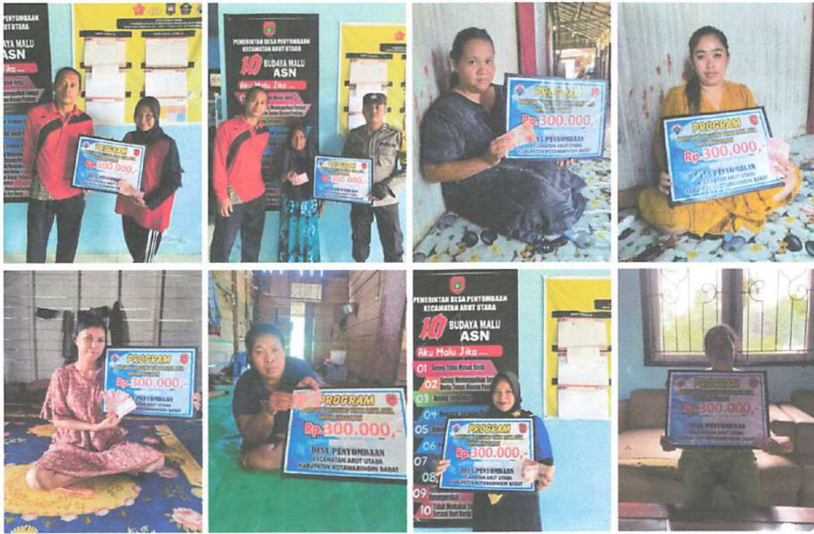
DOKUMENTASI PENERIMAAN BANTUAN LANGSUNG TUNAI DANA DESA (BLT-DD) BULAN OKTOBER TAHUN 2023 DI WAKILKAN OLEH KELUARGA