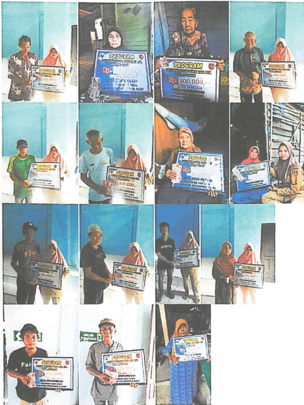
DOKUMENTASI PENERIMA BANTUAN LANGSUNG TUNAI DANA DESA (BLT-DD) BULAN JANUARI TAHUN 2023