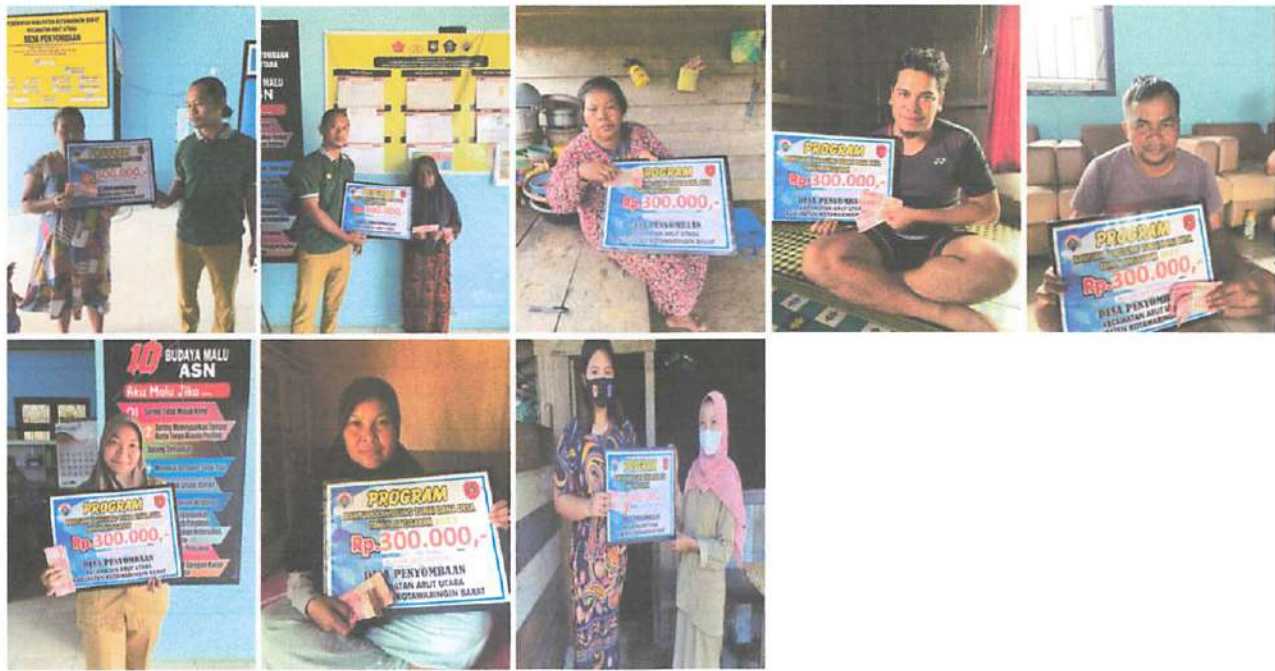
DOKUMENTASI PENERIMAAN BANTUAN LANGSUNG TUNAI DANA DESA (BLT-DD) BULAN SEPTEMBER TAHUN 2023 DIWAKILKAN OLEH KELUARGA