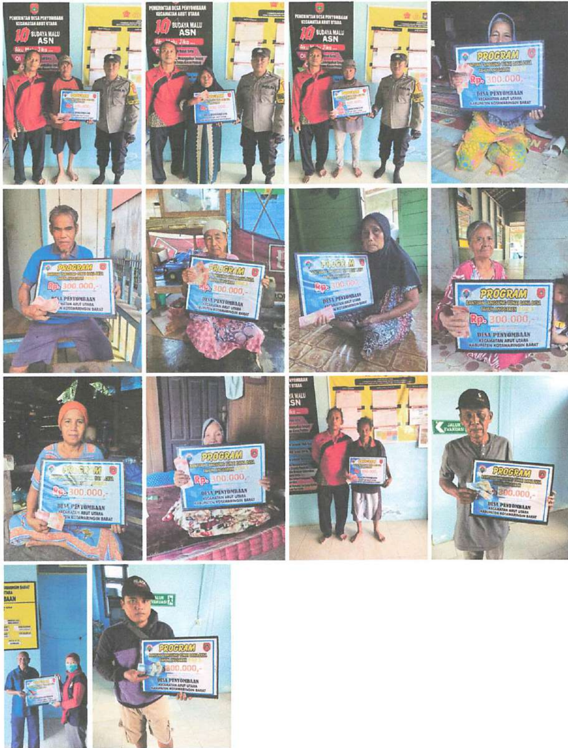
DOKUMENTASI PENERIMAAN BANTUAN LANGSUNG TUNAI DANA DESA (BLT-DD) BULAN NOVEMBER TAHUN 2023