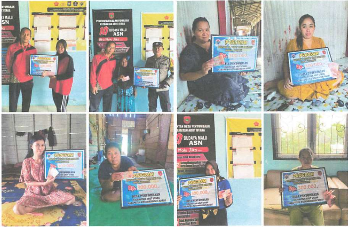
DOKUMENTASI PENERIMAAN BANTUAN LANGSUNG TUNAI DANA DESA (BLT-DD) BULAN NOVEMBER TAHUN 2023 DI WAKILKAN OLEH KELUARGA