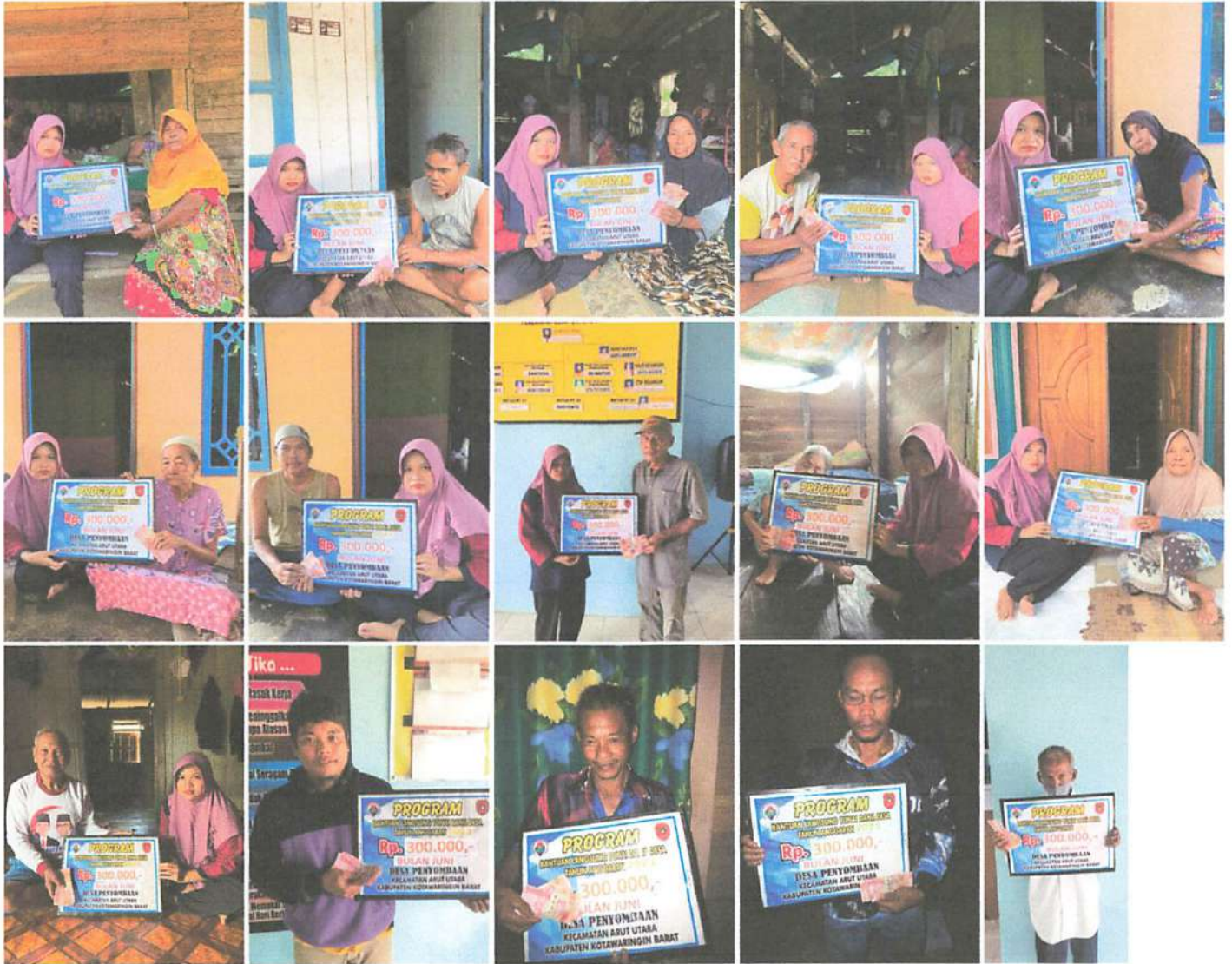
DOKUMENTASI PENERIMAAN BANTUAN LANGSUNG TUNAI DANA DESA (BLT-DD) BULAN JUNI TAHUN 2023