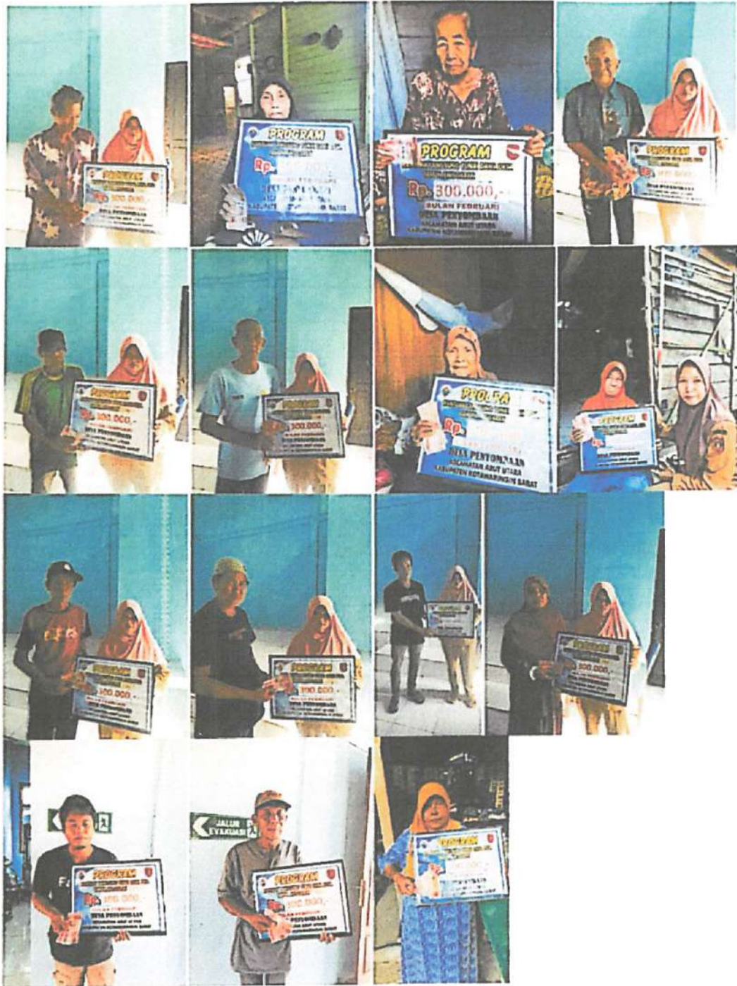
DOKUMENTASI PENERIMA BANTUAN LANGSUNG TUNAI DANA DESA (BLT-DD) BULAN FEBRUARI TAHUN 2023