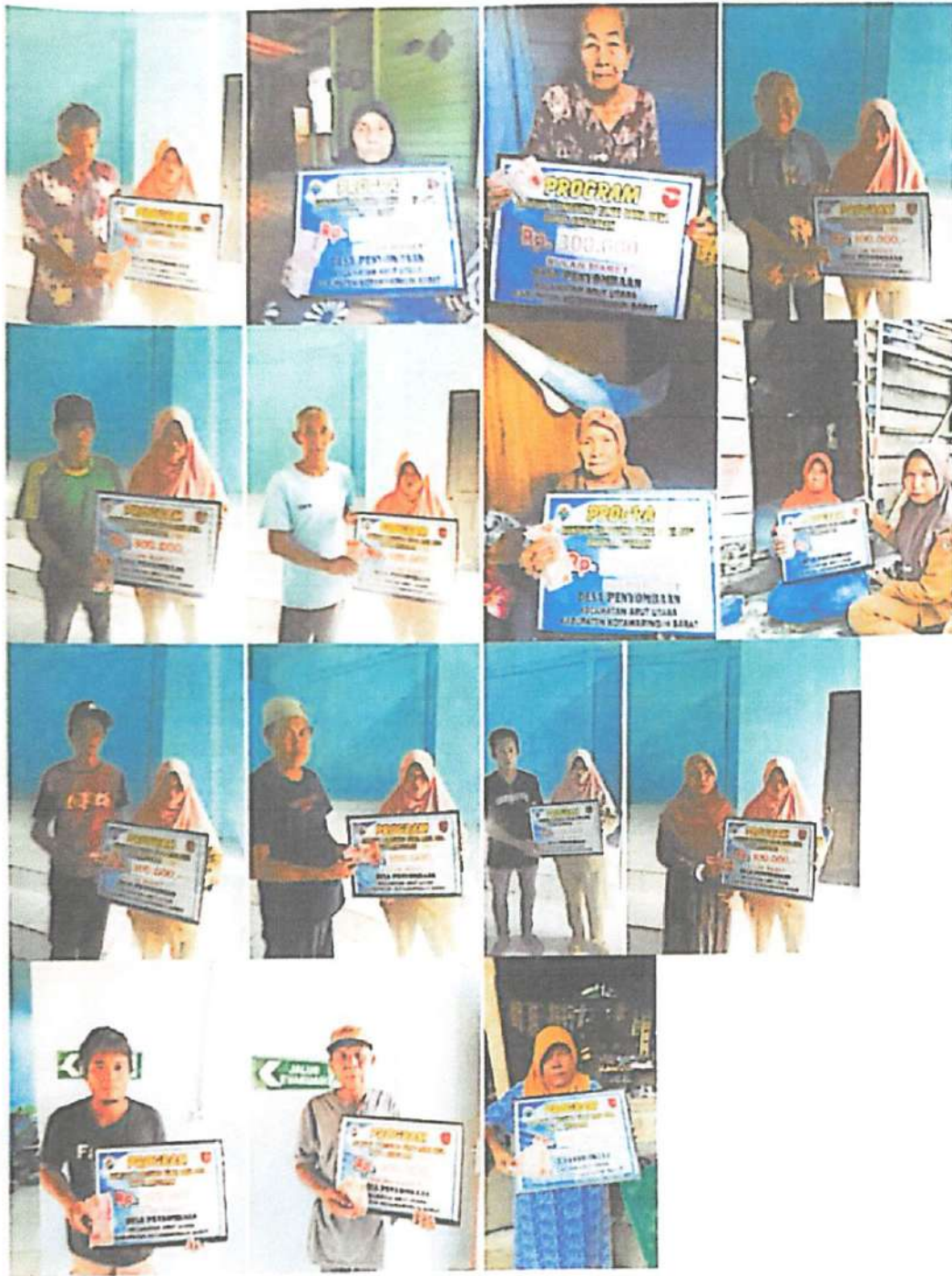
DOKUMENTASI PENERIMA BANTUAN LANGSUNG TUNAI DANA DESA (BLT-DD) BULAN MARET TAHUN 2023