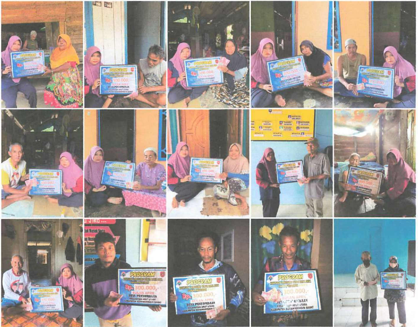
DOKUMENTASI PENERIMA BANTUAN LANGSUNG TUNAI DANA DESA (BLT-DD) BULAN APRIL TAHUN 2023