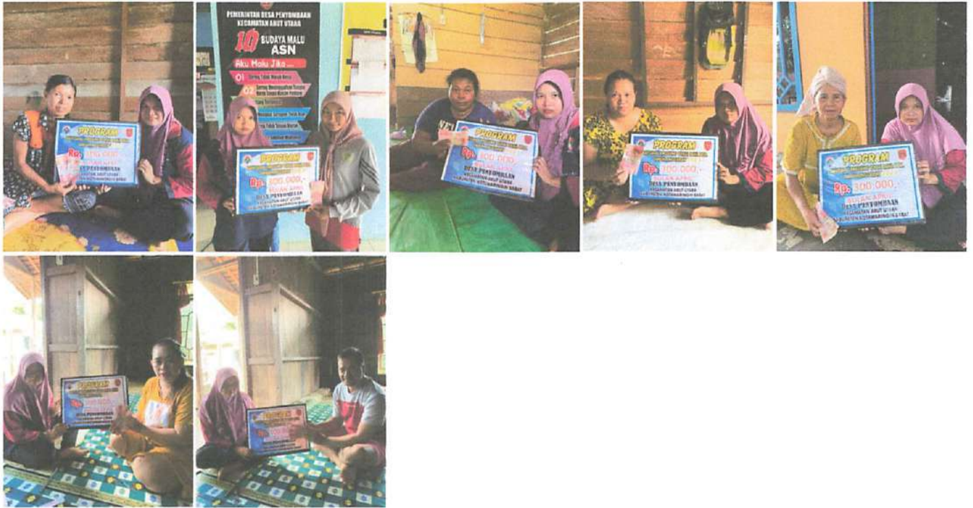
DOKUMENTASI PENERIMAAN BANTUAN LANGSUNG TUNAI DANA DESA (BLT-DD) BULAN APRIL TAHUN 2023 DIWAKILKAN OLEH KELUARGA