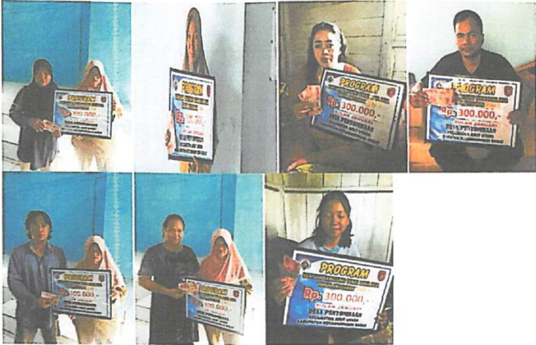
DOKUMENTASI PENERIMAAN BANTUAN LANGSUNG TUNAI DANA DESA (BLT-DD) BULAN JANUARI TAHUN 2023 DIWAKILKAN OLEH KELUARGA