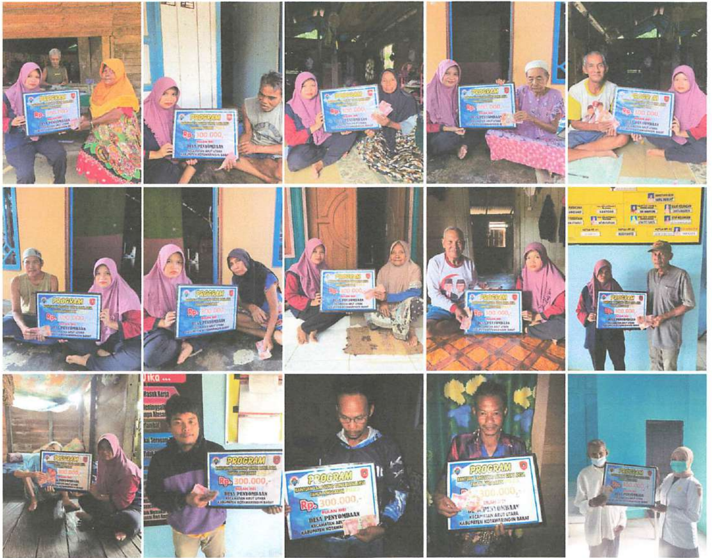
DOKUMENTASI PENERIMAAN BANTUAN LANGSUNG TUNAI DANA DESA (BLT-DD) BULAN MEI TAHUN 2023