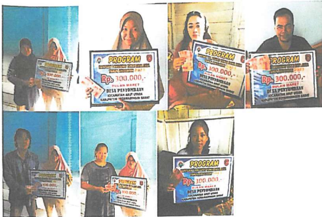
DOKUMENTASI PENERIMAAN BANTUAN LANGSUNG TUNAI DANA DESA (BLT-DD) BULAN MARET TAHUN 2023 DIWAKILKAN OLEH KELUARGA