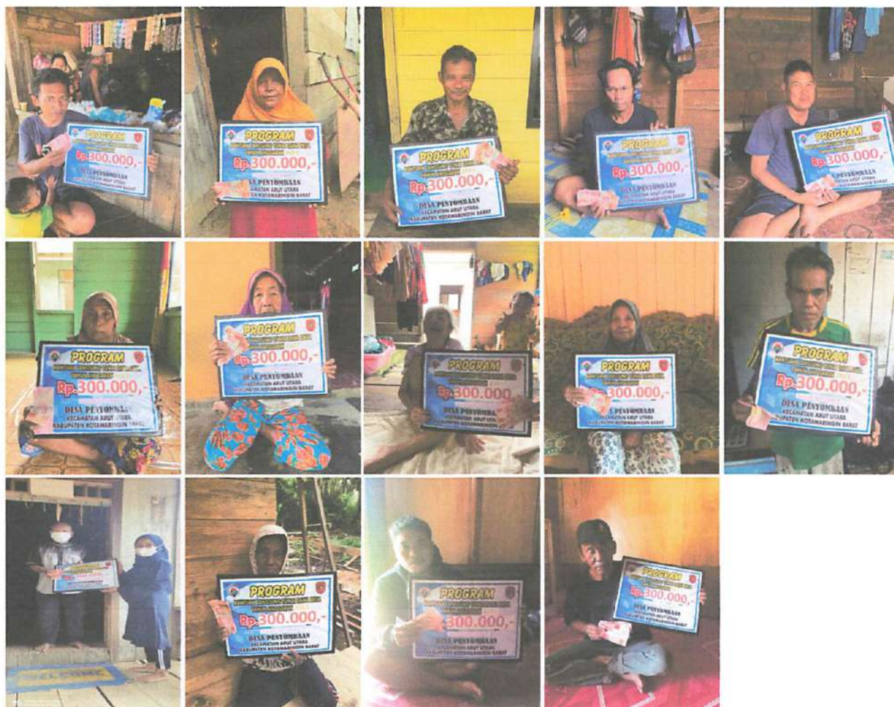
DOKUMENTASI PENERIMAAN BANTUAN LANGSUNG TUNAI DANA DESA (BLT-DD) BULAN SEPTEMBER TAHUN 2023