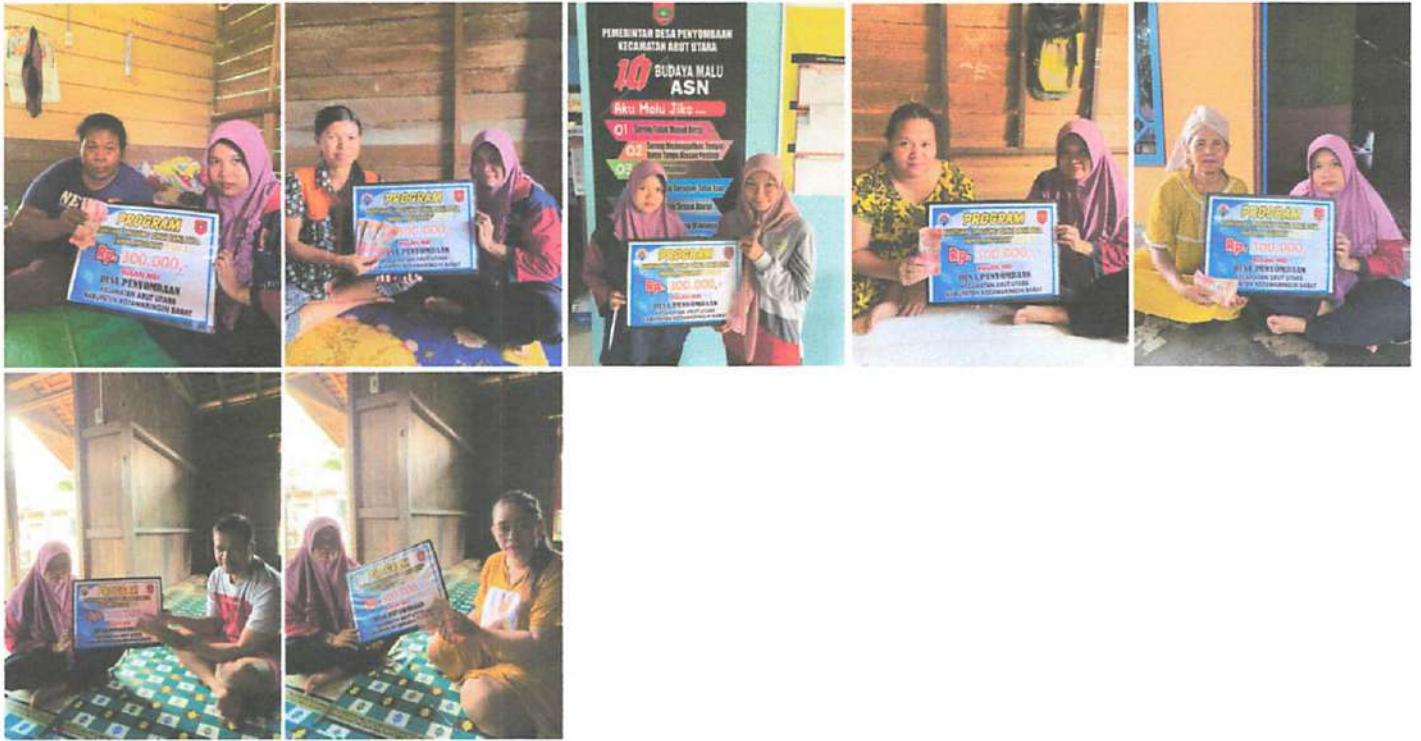
DOKUMENTASI PENERIMAAN BANTUAN LANGSUNG TUNAI DANA DESA (BLT-DD) BULAN MEI TAHUN 2023 DIWAKILKAN OLEH KELUARGA