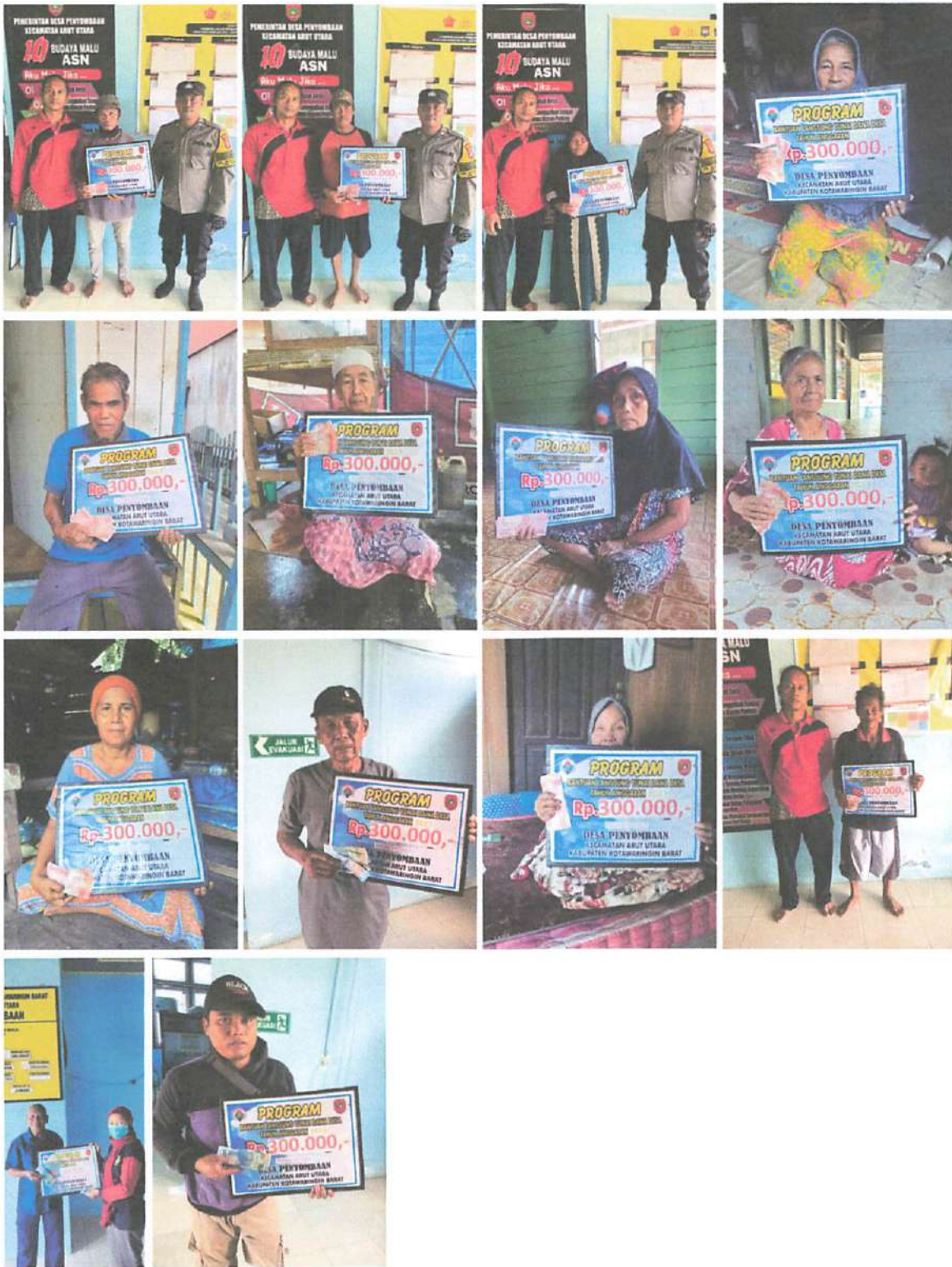
DOKUMENTASI PENERIMAAN BANTUAN LANGSUNG TUNAI DANA DESA (BLT-DD) BULAN OKTOBER TAHUN 2023