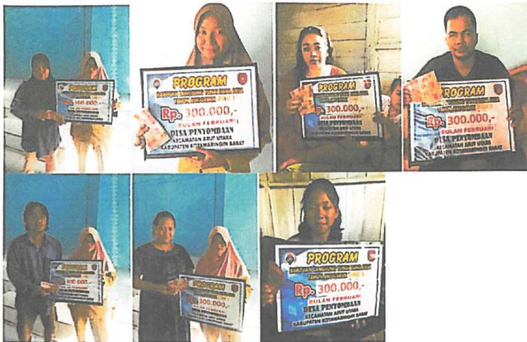
DOKUMENTASI PENERIMAAN BANTUAN LANGSUNG TUNAI DANA DESA (BLT-DD) BULAN FEBRUARI TAHUN 2023 DIWAKILKAN OLEH KELUARGA