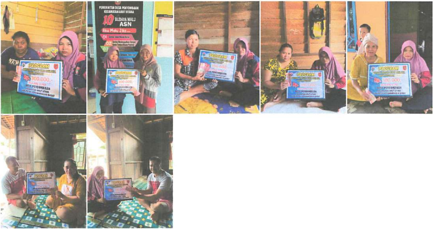
DOKUMENTASI PENERIMAAN BANTUAN LANGSUNG TUNAI DANA DESA (BLT-DD) BULAN JUNI TAHUN 2023 DI WAKILKAN OLEH KELUARGA