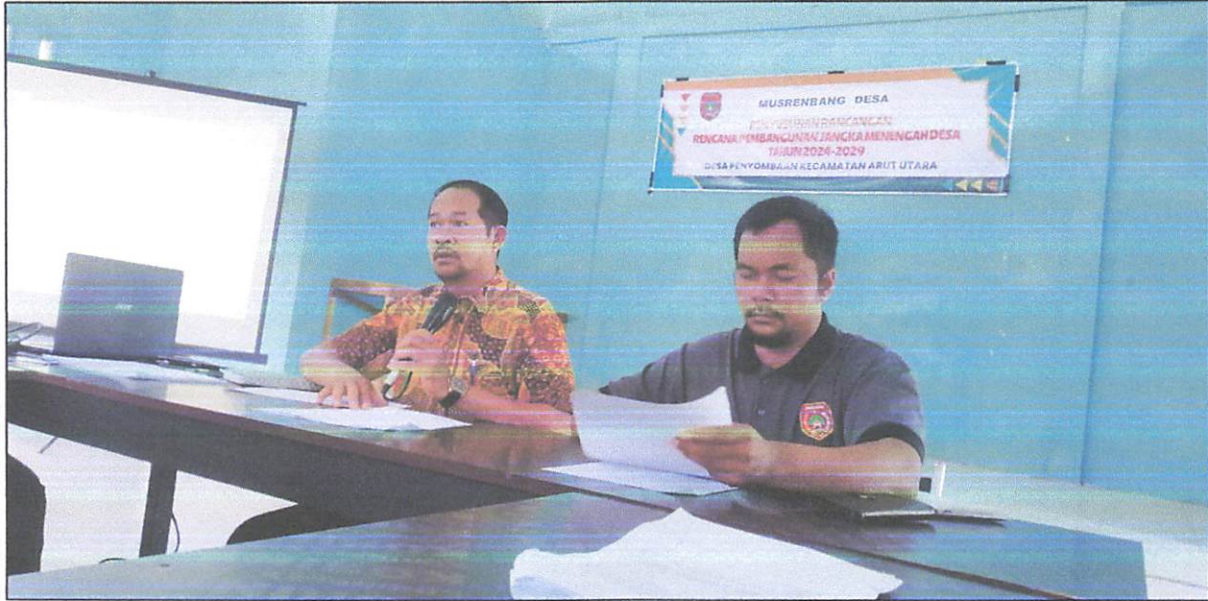
Pemaparan Rancangan RPJMDes, Tahun 2024 – 2029, oleh Ketua BPD Desa Penyombaan