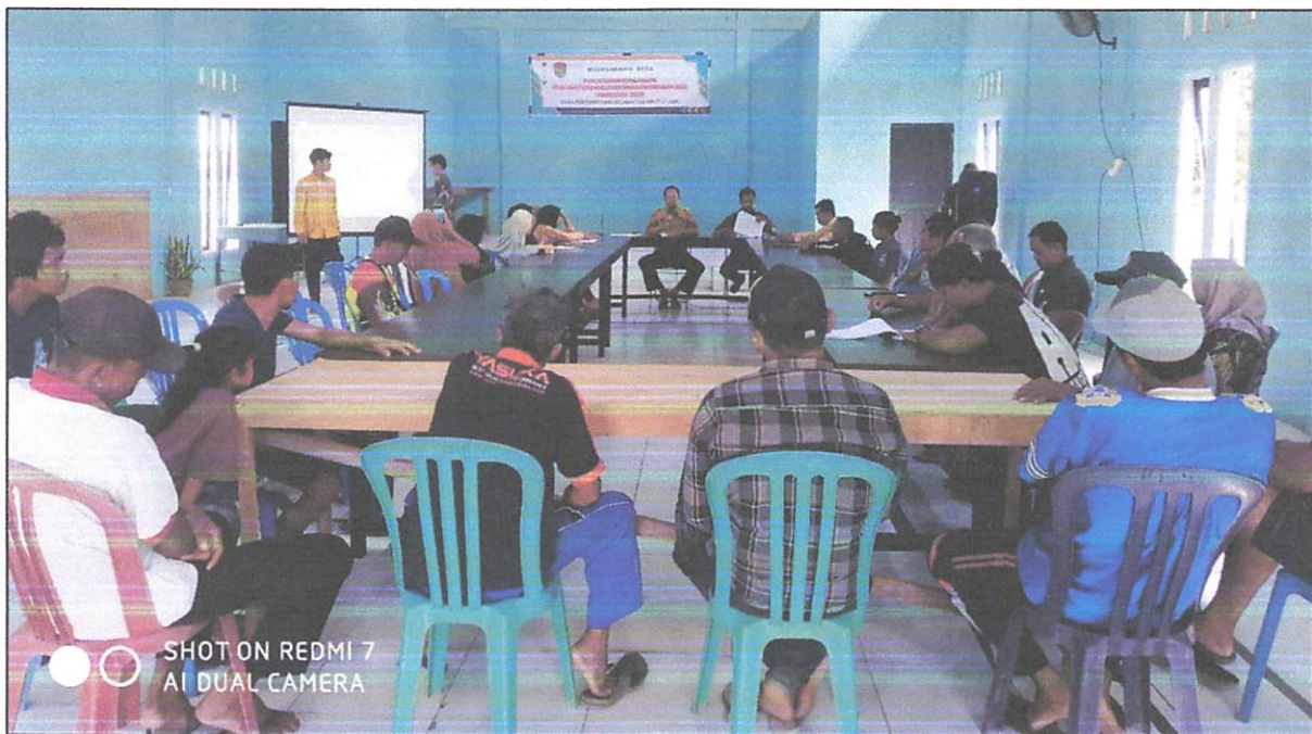
Peserta MUSRENBANG DESA, tentang Rancangan Pembangunan Jangka Menengah Desa (RPJMDes) Desa Penyombaan Tahun 2024 – 2029