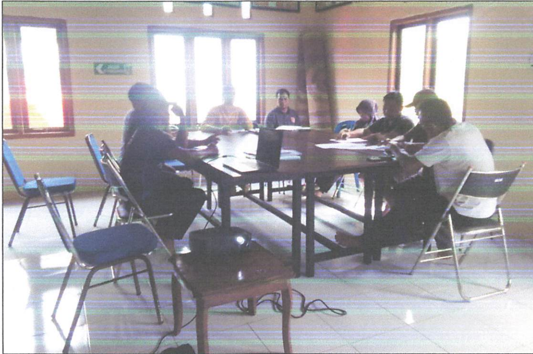
Kegiatan Pembahasan Penetapan Perdes RPJMDes Tahun 2024 – 2029