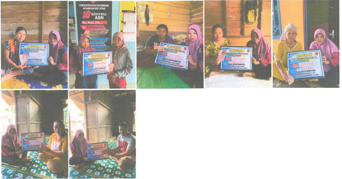
DOKUMENTASI PENERIMAAN BANTUAN LANGSUNG TUNAI DANA DESA (BLT-DD) BULAN APRIL TAHUN 2023 DIWAKILKAN OLEH KELUARGA