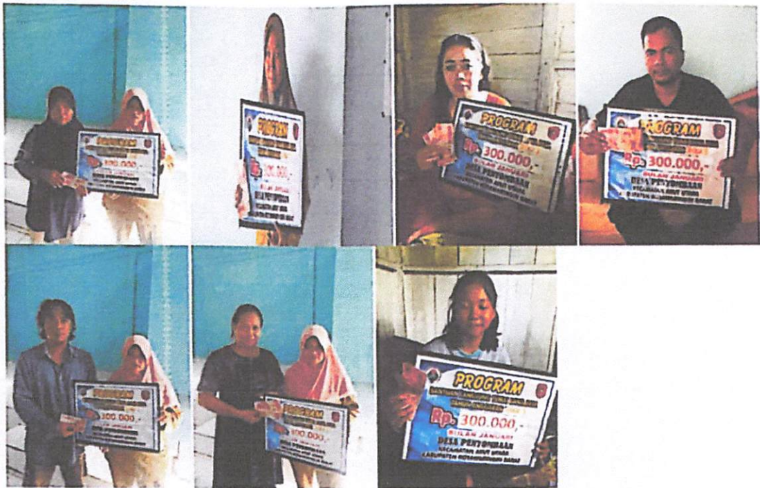
DOKUMENTASI PENERIMAAN BANTUAN LANGSUNG TUNAI DANA DESA (BLT-DD) BULAN JANUARI TAHUN 2023 DIWAKILKAN OLEH KELUARGA