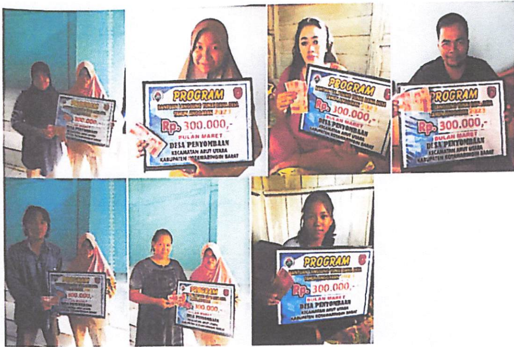
DOKUMENTASI PENERIMAAN BANTUAN LANGSUNG TUNAI DANA DESA (BLT-DD) BULAN MARET TAHUN 2023 DIWAKILKAN OLEH KELUARGA