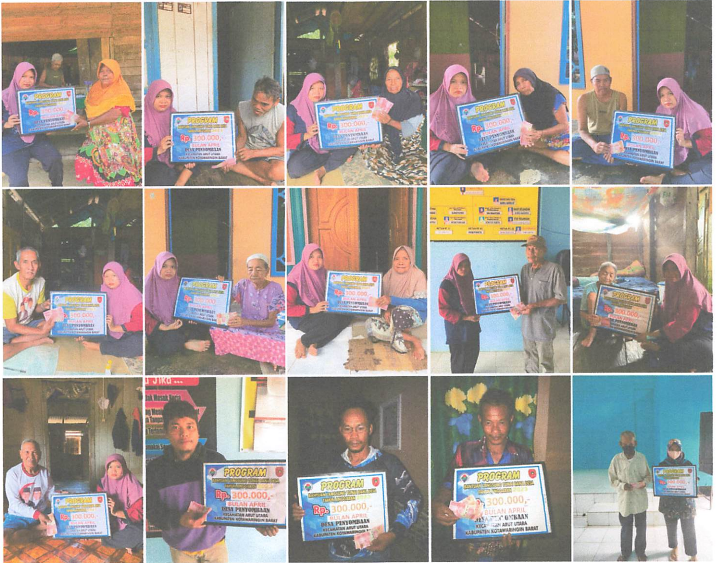
DOKUMENTASI PENERIMA BANTUAN LANGSUNG TUNAI DANA DESA (BLT-DD) BULAN APRIL TAHUN 2023