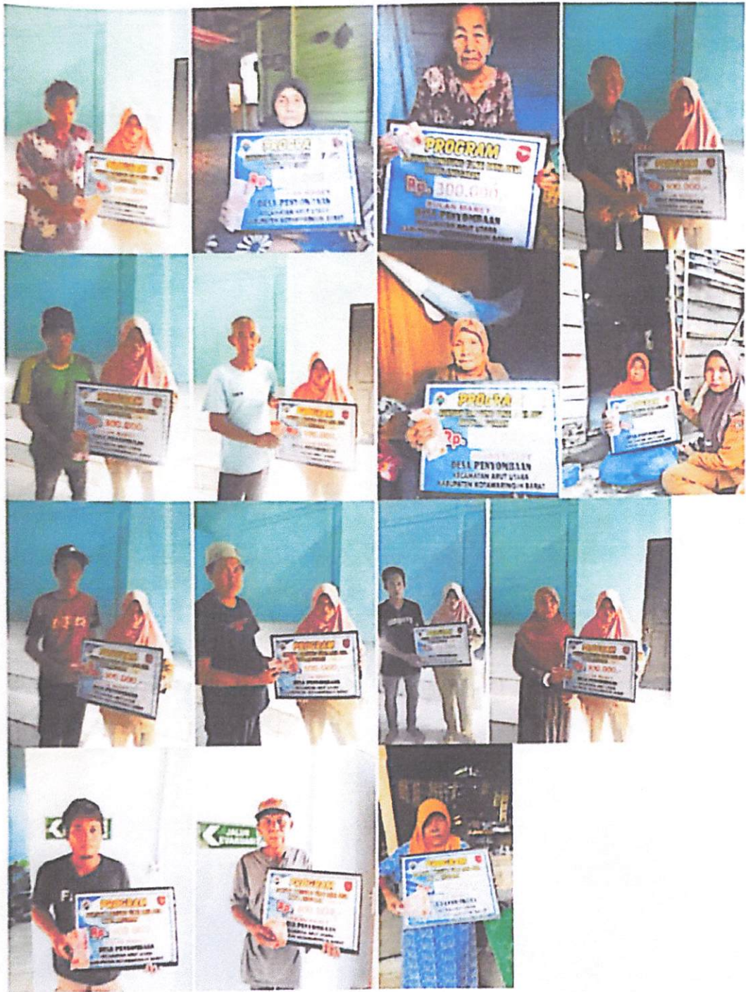
DOKUMENTASI PENERIMA BANTUAN LANGSUNG TUNAI DANA DESA (BLT-DD) BULAN MARET TAHUN 2023