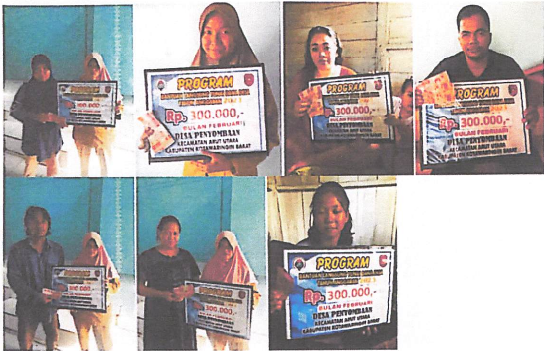
DOKUMENTASI PENERIMAAN BANTUAN LANGSUNG TUNAI DANA DESA (BLT-DD) BULAN FEBRUARI TAHUN 2023 DIWAKILKAN OLEH KELUARGA