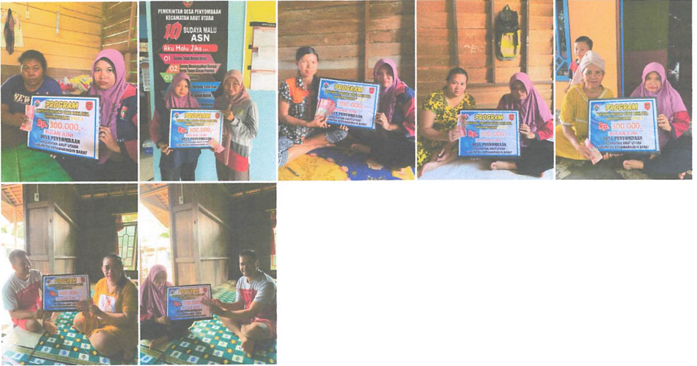
DOKUMENTASI PENERIMAAN BANTUAN LANGSUNG TUNAI DANA DESA (BLT-DD) BULAN JUNI TAHUN 2023 DI WAKILKAN OLEH KELUARGA