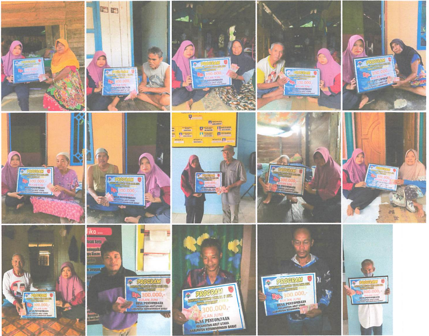
DOKUMENTASI PENERIMAAN BANTUAN LANGSUNG TUNAI DANA DESA (BLT-DD) BULAN JUNI TAHUN 2023