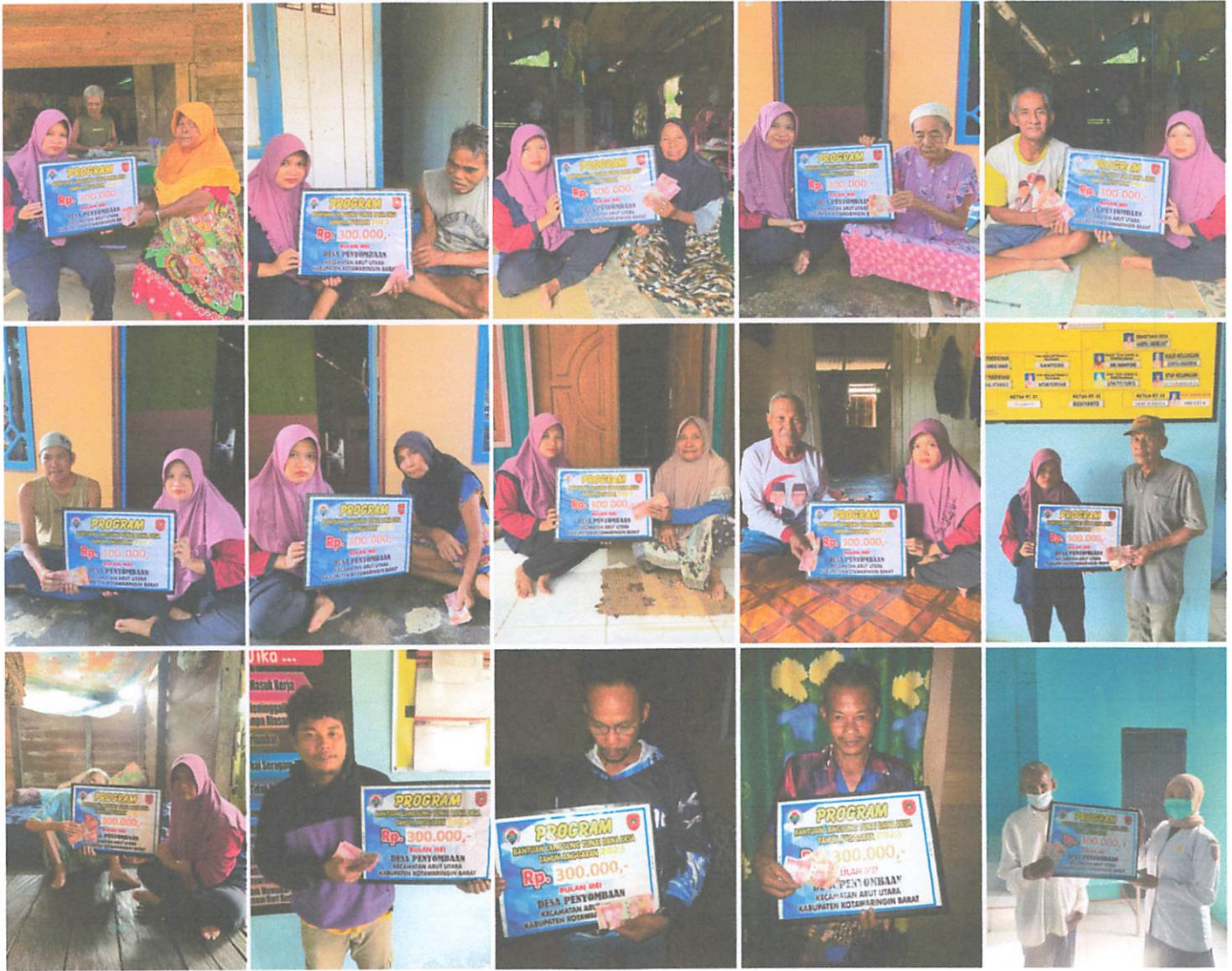
DOKUMENTASI PENERIMAAN BANTUAN LANGSUNG TUNAI DANA DESA (BLT-DD) BULAN MEI TAHUN 2023