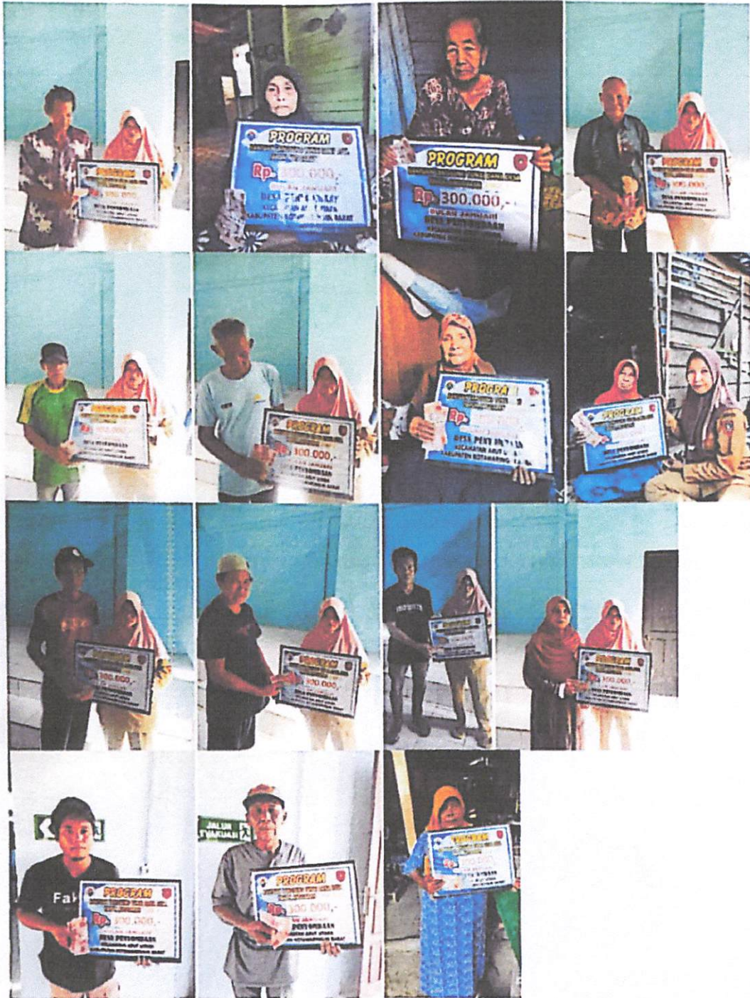
DOKUMENTASI PENERIMA BANTUAN LANGSUNG TUNAI DANA DESA (BLT-DD) BULAN JANUARI TAHUN 2023