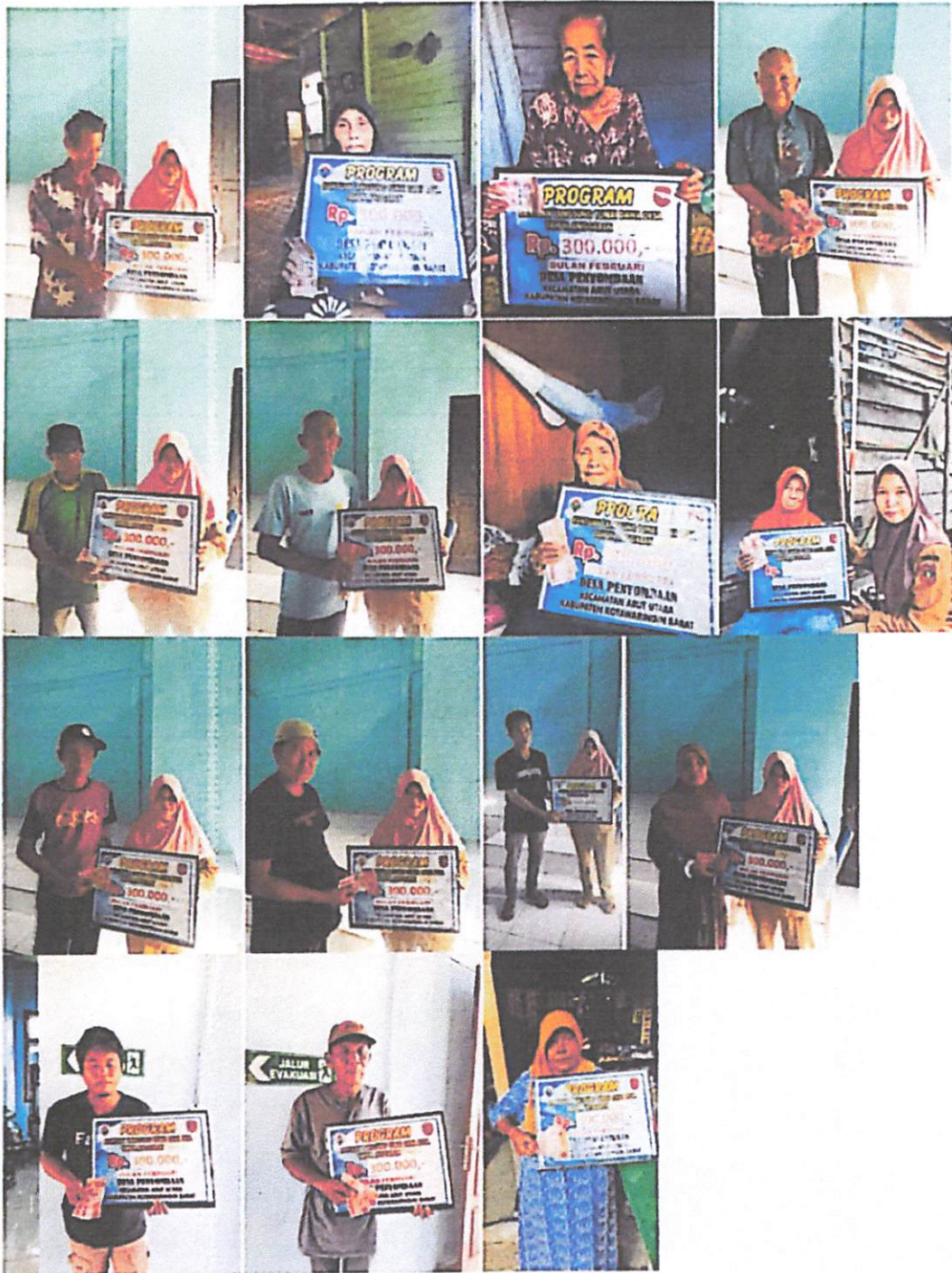
DOKUMENTASI PENERIMA BANTUAN LANGSUNG TUNAI DANA DESA (BLT-DD) BULAN FEBRUARI TAHUN 2023