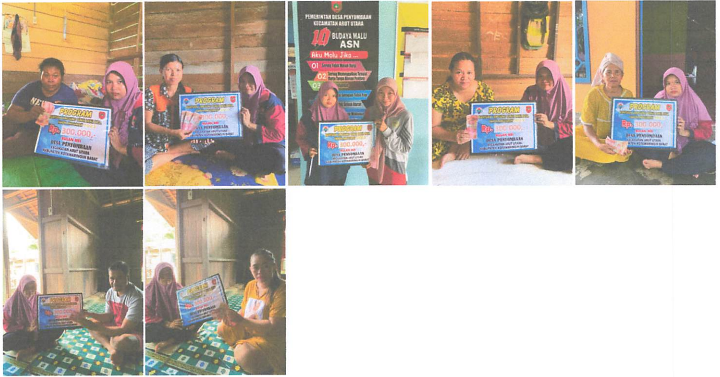
DOKUMENTASI PENERIMAAN BANTUAN LANGSUNG TUNAI DANA DESA (BLT-DD) BULAN MEI TAHUN 2023 DIWAKILKAN OLEH KELUARGA